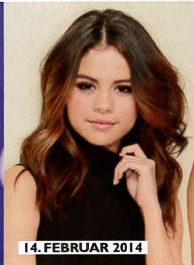
14. FEBRUAR 2014