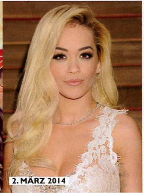
2. MÄRZ 2014

LANG, KURZ, LANG, KURZ, LANG... Die Stars wechseln neuerdings ihre Haarlänge so schnell wie Heidi Klum ihre Männer. Der Trick dahinter, klar: Extensions! Dank neuer Techniken ist der Wechsel von Kurzhaarschnitt auf Mähne nämlich super easy , und jemand wie Beyoncé kann das schon fast während einer Konzertpause erledigen lassen.