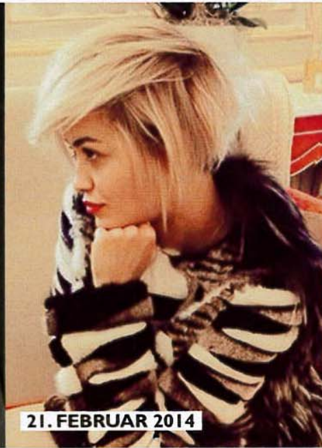
21. FEBRUAR 2014