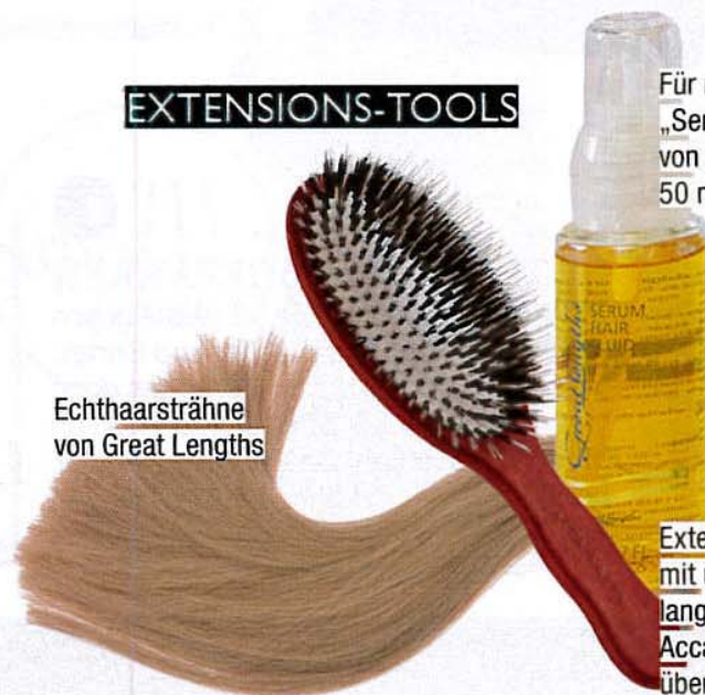
Echthaarsträhne von Great Lengths

Für mehr Glanz: „Serum Hair Fluid“ von Great Lengths, 50 ml ca. 20 Euro